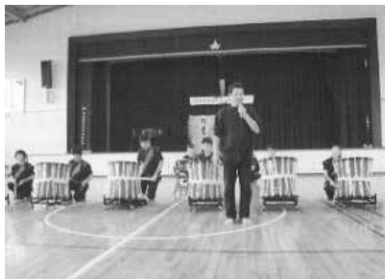
太鼓 (H25 年度実施)